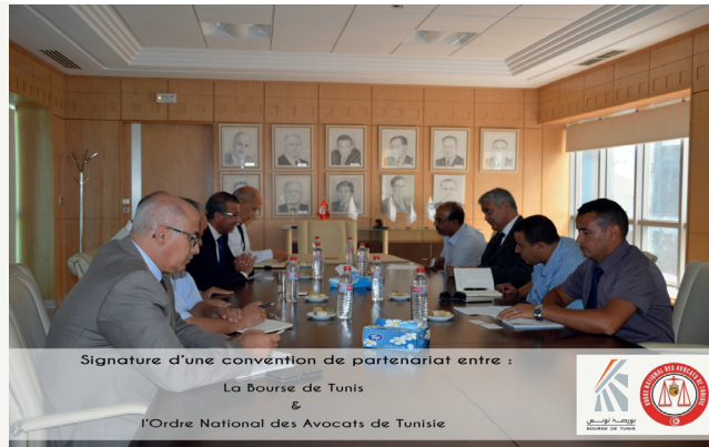
Signature d'une convention de partenariat entre : La Bourse de Tunis & l'Ordre National des Avocats de Tunisie

Les deux parties ont également convenu d'étendre leur coopération aux travaux et réflexions menés par les acteurs de la Place et portant sur la modernisation du cadre légal et réglementaire régissant le marché financier tunisien.